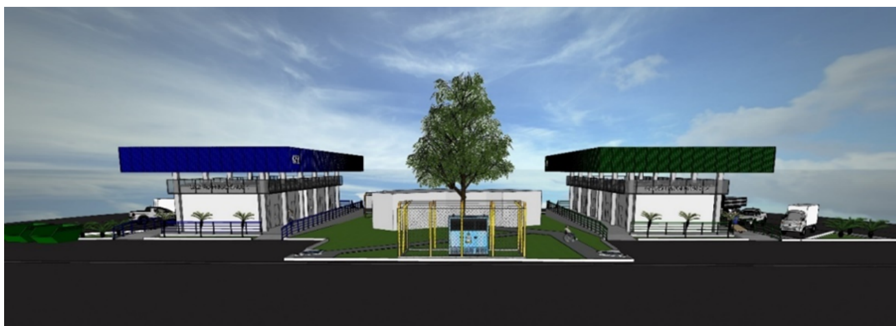
Figuras 05 – Projeto de 02 galpões frigoríficos