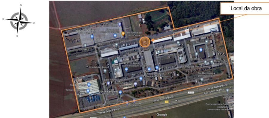
Figura 01 – Localização do terreno dentro da CEASA Campinas

A área de implantação das edificações está situada dentro da planta da CEASA Campinas, localizada na Rodovia Dom Pedro I, km 140,50 – Pista Norte – Barão Geraldo – Campinas/SP.